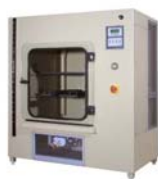
Camere a Nebbia Salina verticali.