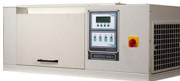
SOLARBOX 3000 E

Di conseguenza, in quanto la temperatura produce un invecchiamento accelerato, è essenziale essere in grado di controllare la B.S.T. durante la prova di esposizione a radiazione Xeno filtrata.