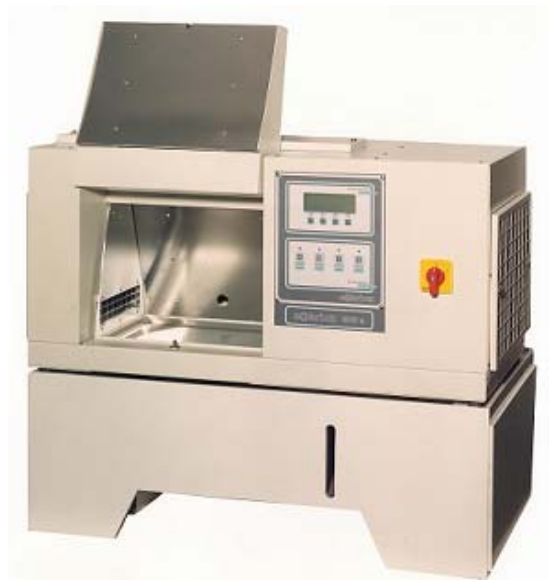
SOLARBOX 1500 E con FLOODING

Materiali in PVC e resistenti alla corrosione assicurano lunga vita al sistema. Capacità fino a 50 litri.