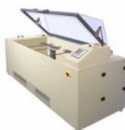
Camere a Nebbia Salina orizzontali.