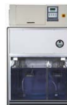
SOLARBOX R.H. con Controllo Umidità

Ci riserviamo il diritto di apportare cambiamenti ad attrezzature e sistemi in risposta agli avanzamenti tecnologici e di modificare i valori dei parametri di conseguenza.